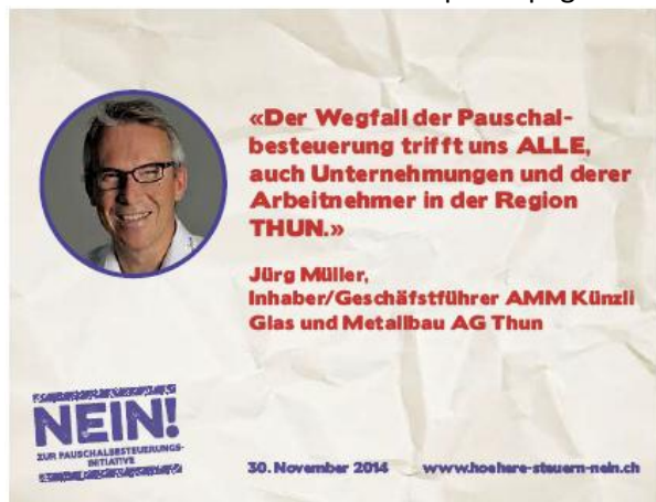
Berner Zeitung, 14.11.2014