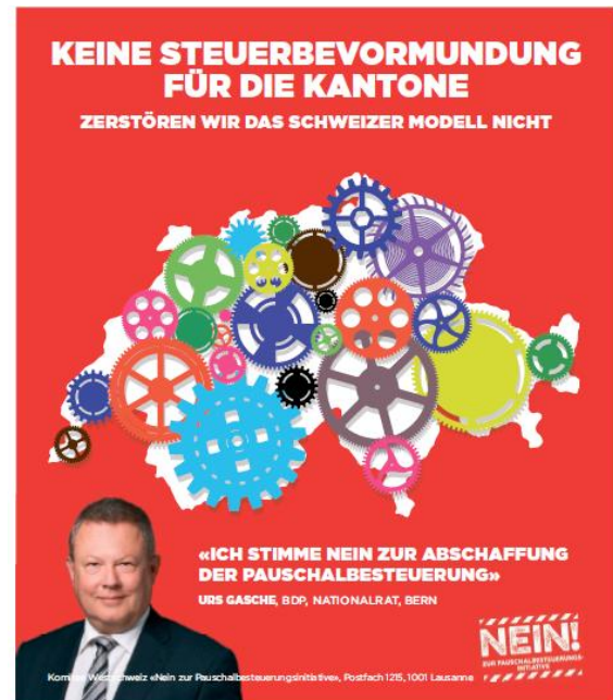
Der Bund, 14.11.2014