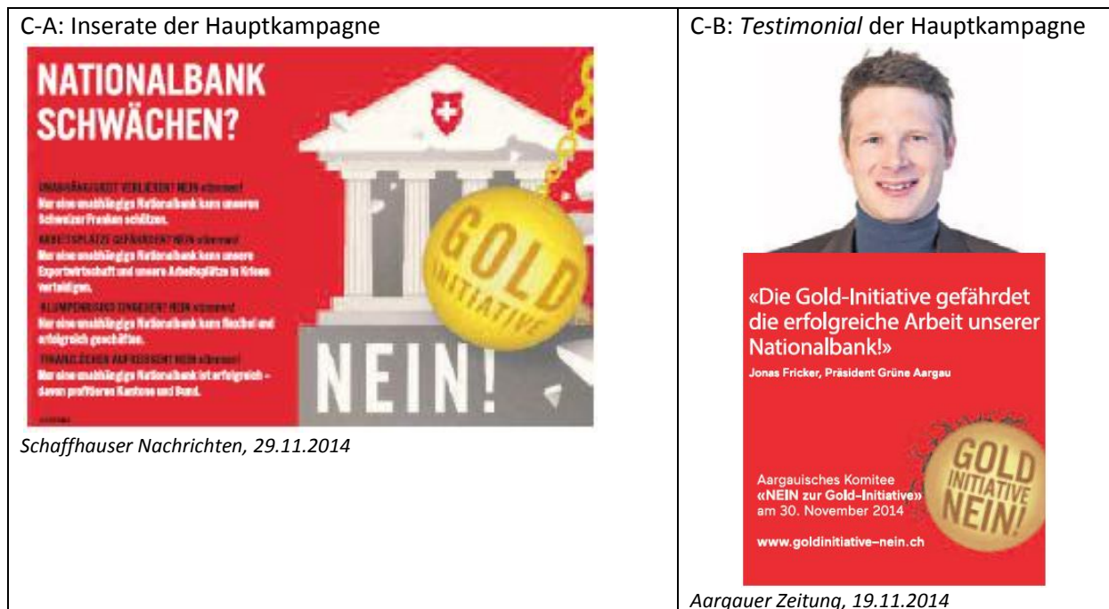
Abbildung 3.2: Illustrative Beispiele der wichtigsten Inseratetypen des Contra-Lagers