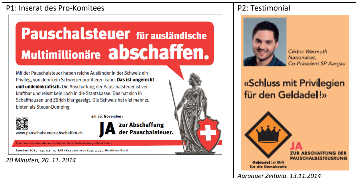
Abbildung 2.1: Illustrative Beispiele der wichtigsten Inseratetypen des Pro-Lagers

Die Inseratekampagne der Initiativgegner schien dagegen weitgehend zentralisiert gesteuert worden zu sein. Das Engagement des Contra-Lagers im gekauften Raum wurde stark vom nationalen Komitee „Nein zur Pauschalbesteuerungs-Initiative“ geprägt, dem der Schweizerische Gewerbeverband (SGV) vorstand. 430 der 501 der Inserate der gegnerischen Seite wiesen denn auch das Design der Hauptkampagne auf. Dabei trat in 393 Fällen das nationale