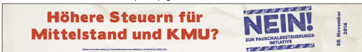
Die Südostschweiz, 3.11.2014