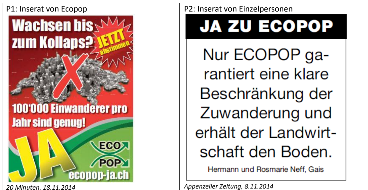
Abbildung 3.1: Illustrative Beispiele der wichtigsten Inseratetypen des Pro-Lagers

Auf Seiten der Initiativgegner spielten Komitees eine zentrale Rolle. In knapp drei von vier Fällen traten verschiedene Komitees als Inserenten in Erscheinung. Grossmehrheitlich stammten diese vom überparteilichen Komitee „Ecopop Nein“, das vom Wirtschaftsdachverband Economiesuisse geleitet wurde. Aus der Abbildung 3.2 gehen ein herkömmliches und ein Testimonial -Inserat die Hauptkampagne des Contra Lagers hervor (Typen C1-A und C1-b). Diese setzte sich mit fluoreszierend gelber Farbe für ein Nein ein.