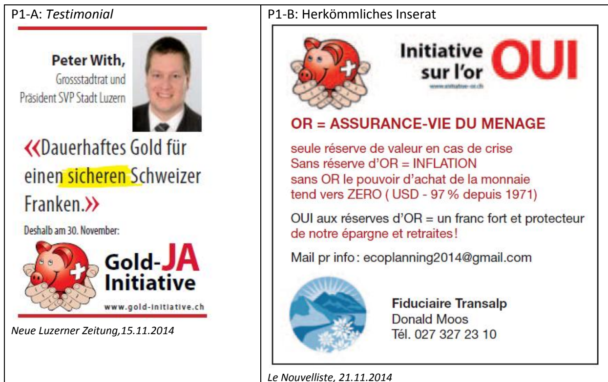
Abbildung 4.1: Die zwei Inserate des Pro-Lagers

Auf Seiten der Initiativgegner spielten Komitees eine zentrale Rolle. In der Tat wurden sämtliche Presseanzeigen von dieser Akteurskategorie aufgegeben. Obwohl meist kantonale Komitees als Inserenten fungierten, kann von einem landesweit einheitlichen Auftritt die Rede sein. In graphischer Hinsicht waren der rote Hintergrund sowie eine goldene Kugel, die in die Inserate einschlug, charakteristisch. Dabei dominierten Testimonial -Inserate. In knapp drei von vier Fällen griffen die Gegner auf diese Form zurück. Bei den restlichen Anzeigen handelte es sich um herkömmliche Inserate, in denen sowohl Bild- als auch Text-Element enthalten waren. Aus der Abbildung 4.2 geht zu illustrativen Zwecken jeweils ein Beispiel dieser zwei Inseratetypen hervor.