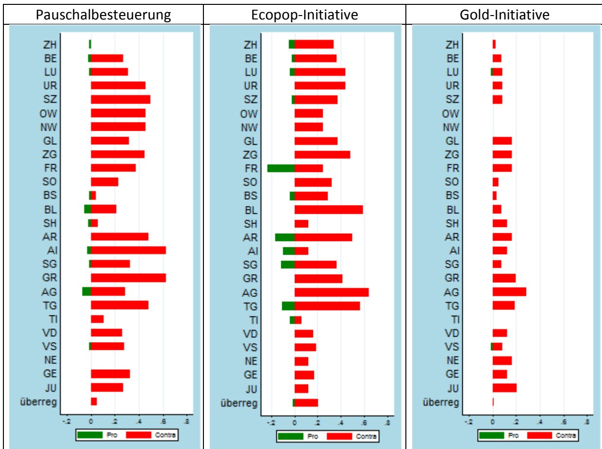
Graphik 1.2: Inserate pro Ausgabe in den Kantonen

Neuenburg keine Inserate, die für ein Festhalten am Status Quo plädierten. In Bezug auf die befürwortende Seite der Ecopop-Initiative lässt sich im Kanton Freiburg die weitaus höchste Publikationsfrequenz feststellen. Ebenfalls präsent war dieses Lagern in zehn weiteren Kantonen (ZH, BE, LU, SZ, BS, AR, AI, SG, TG und TI). Demgegenüber waren die Gegner der Ecopop-Initiative in der gesamten Schweiz mit Inseraten aktiv. Bevorzugt wurden dabei vereinzelte semi-urbane Kantone der Deutschschweiz. Die höchste Publikationsintensität konnte im Kanton Aargau registriert werden (0.64 Inserate pro Zeitungsausgabe). Dahinter folgten Basel-Landschaft (0.59), Thurgau (0.56) und Zug (0.48). Weit weniger stark berücksichtigt wurden die Kantone der lateinischen Schweiz im Allgemeinen und das Tessin im Besonderen. Was die Gold-Initiative anbetrifft, geht aus der Graphik 1.2 hervor, dass die beiden Pro-Inserate in den Kantonen Luzern und Wallis platziert wurden. Die Gegner traten ihrerseits mit Ausnahme der Kantone Obwalden, Nidwalden und Tessin flächendeckend in Erscheinung. Obenaus schwang wiederum der Kanton Aargau mit einer Intensität von 0.29 Inseraten pro Zeitungsausgabe.